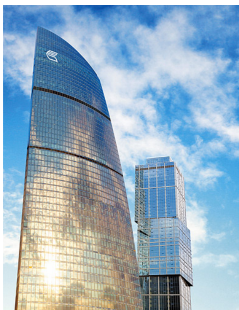
VTB 总部 俄罗斯莫斯科

VTB Bank一直以渐进式的发展战略做指导，始终运用最新自动化工具和服务来提高业务效率。在2013年初，为实现战略目标的稳步增长和利润的大幅度提升，VTB银行总办事处针对本银行俄罗斯境内的下属部门推出了“区域网络改革”大型项目，项目涉及110多家地方分支机构共1023个办事处。改革的目标是改进系统并实现关键业务流程自动化。